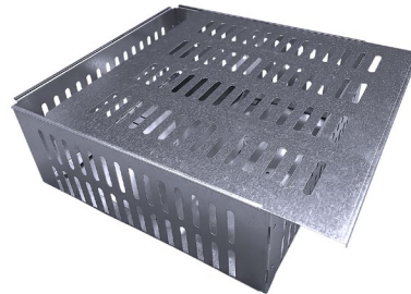
Pare-gravier de protection avec couvercle amovible coulissant